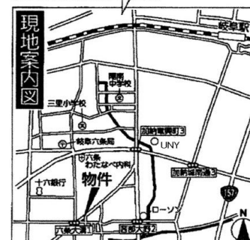
※図面と現況が相違する場合は現況優先とします。

設計住宅性能評価書取得予定 建設住宅性能評価書取得予定 住宅性能表示制度とは、構造の安定、火災時の安全、高齢者等への配慮など共通に定められた方法を用いて客観的に示し、第三者が住宅の性能についての評価をすることで、住宅取得者に対して住宅の性能に関する信頼性の高い情報を提供する仕組みです。