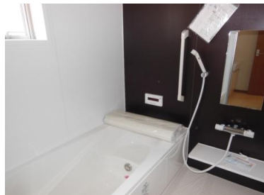
一日の疲れを癒す快適なバスルーム!!

返済例 ①号棟2190万円の場合 十六銀行 変動金利35年返済金利0.525%(金利優遇適用後) 金利は10月1日現在のものです。審査結果によっては、お借入金額ならびに、お借入利率等の 条件面でご希望にそいかなる場合があります。別途諸費用等がかかります。