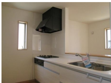
対面キッチン 収納たっぷり、お料理らくらく!