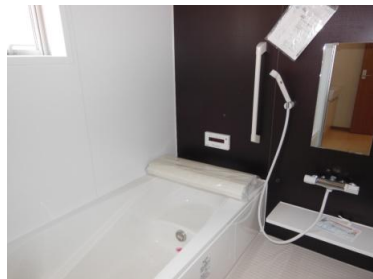
一日の疲れを癒す快適なバスルーム！！

返済例 ①号棟2190万円の場合 十六銀行 変動金利35年返済金利0.525%(金利優遇適用後) 金利は10月1日現在のものです。審査結果によっては、お借入金額ならびに、お借入利率等の 条件面でご希望にそいかなる場合があります。別途諸費用等がかかります。