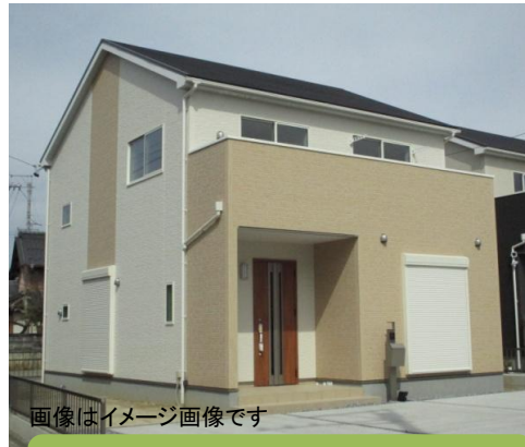
画像はイメージ画像です